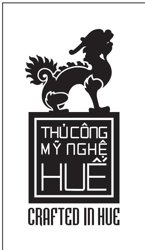
PHƯƠNG ÁN DƯƠNG BẢN