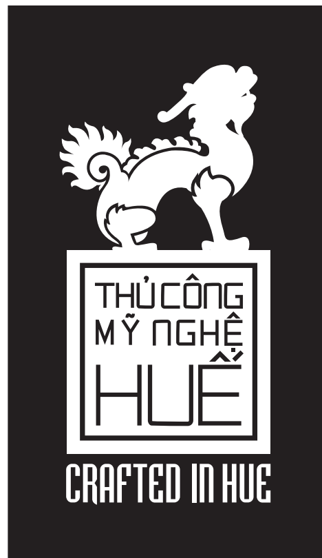
PHƯƠNG ÁN ÂM BẢN